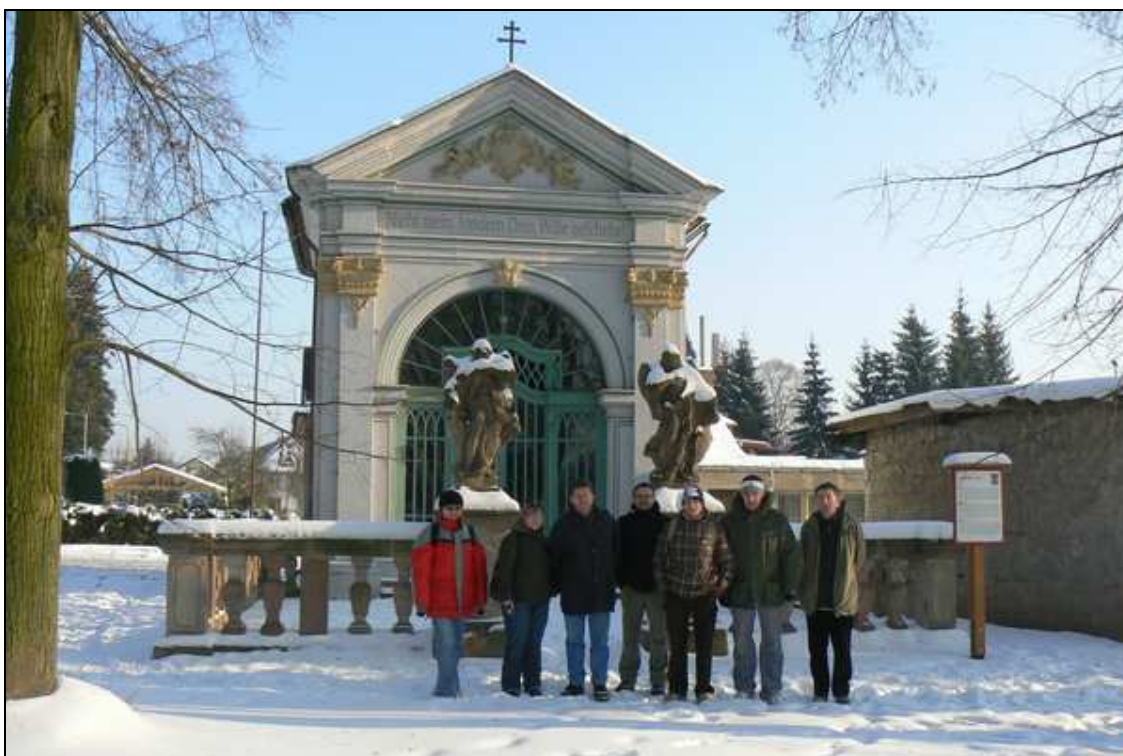
Olivetská kaple, v popředí naše skupina