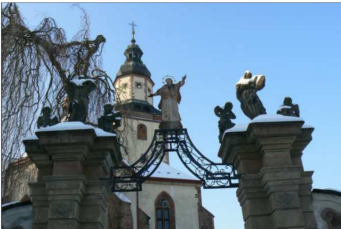
kostel Nejsvětější Trojice