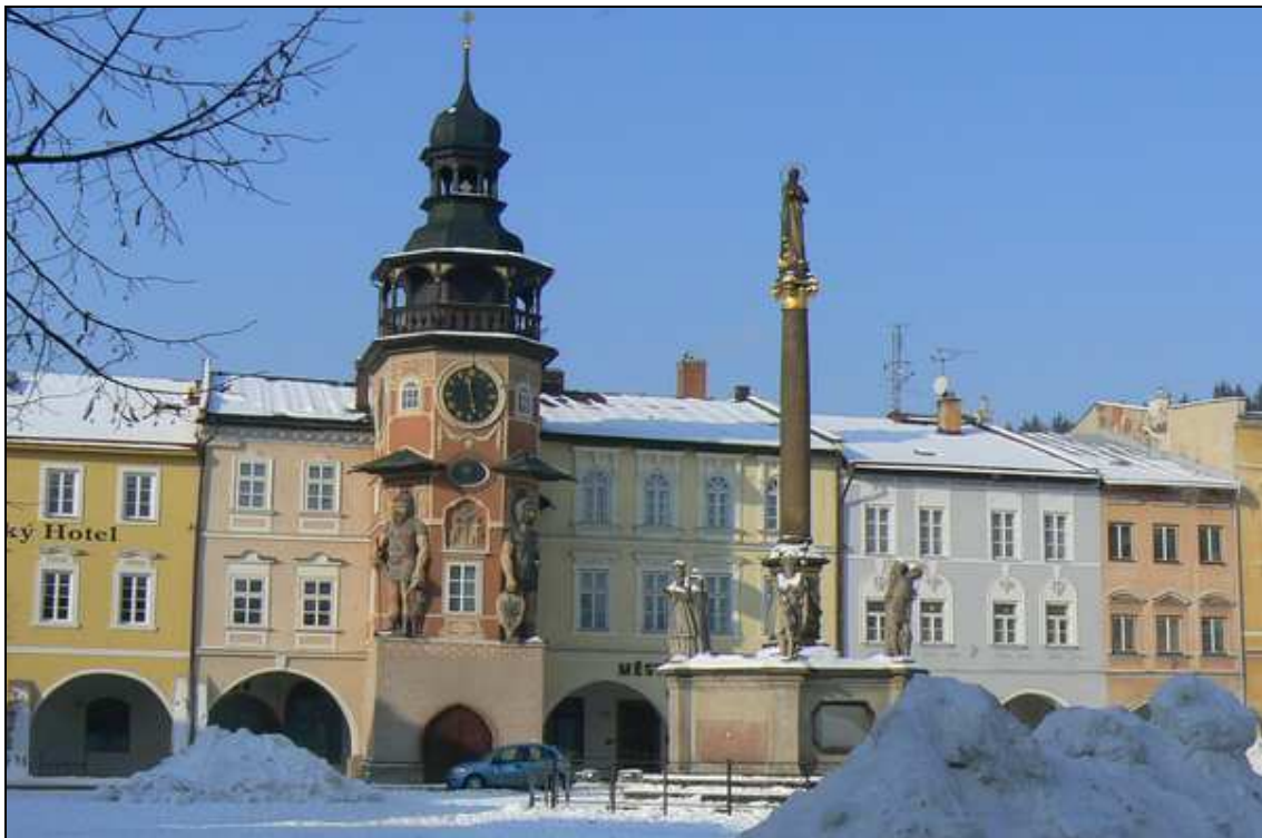
renesanční radnice a Mariánský sloup na náměstí