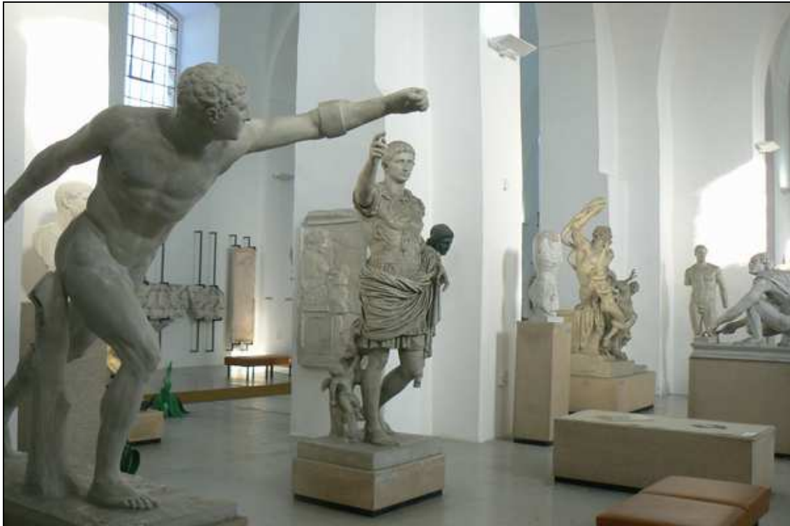
interiér Galerie antického umění