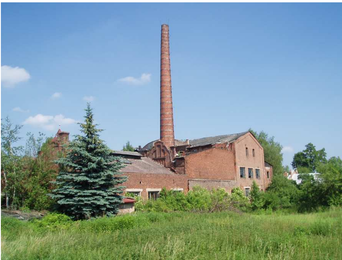
pohled od jihozápadu (směrem od Prahy)