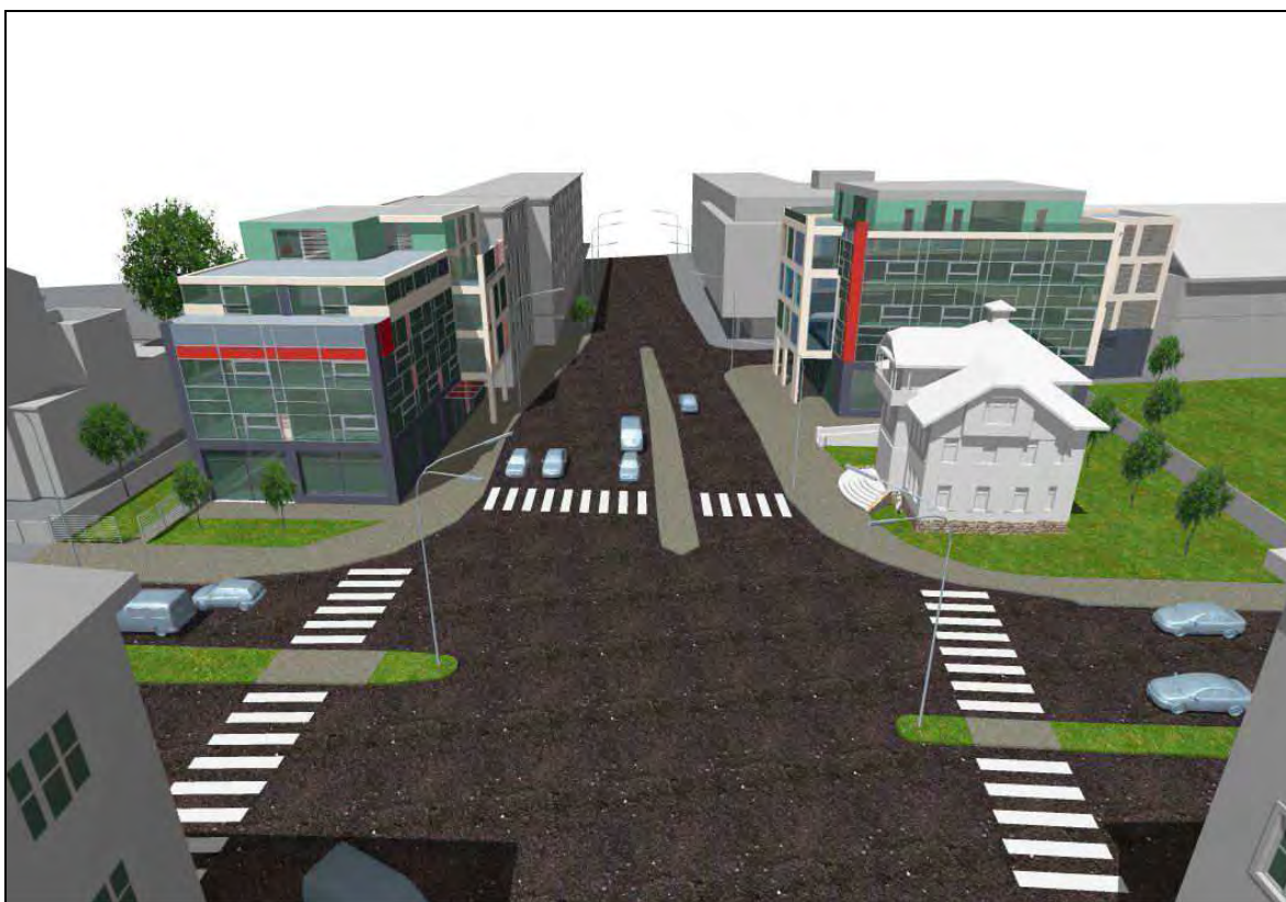
Vizualizace projektu Pojišťovny Generali na výstavbu nového centra služeb.

Vzhledem k tomu, že občanská sdružení, působící v oblasti památkové péče nejsou (na rozdíl například od občanských sdružení v oblasti ochrany přírody) účastníky stavebního řízení, nemohli jsme vznášet žádné protesty či námítky. V současné době má investor platné stavební povolení, v nové výstavbě mu proto nic nebrání.