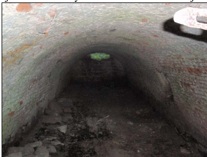
Sklep pod sýpkou, jižní část zderaz. dvora (11/2009)

Na základě archeologického průzkumu, ke kterému došlo v roce 2008, lze usuzovat na středověké osídlení v období 13.-14. století. První písemná zpráva o vsi Zderaz pochází z roku 1411, kdy je zmíněna coby součást habřinského majetku Petra z Hustířan. Po roce 1533 Habřinu spolu se Zderazí získává Mikuláš Trčka z Lípy a připojuje je ke svému smiřickému panství. Coby součást smiřického dominia Trčků je Zderaz jako ves naposledy zmíněna v urbáři z roku 1588 a zřejmě záhy zaniká, neboť urbář z roku 1619 uvádí pouze dvůr. Ten je po roce 1661 připojen k nově vytvořenému panství Hořiněves, náležejícímu Františku Ferdinandovi Gallasovi.