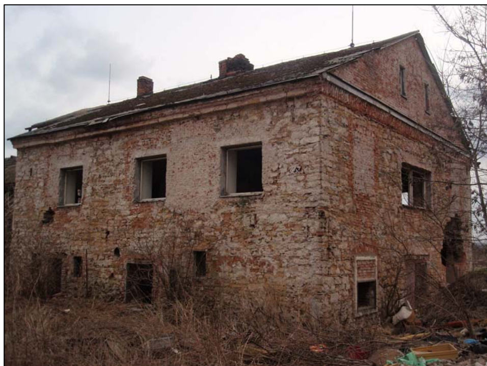
Zv. zámeček (03/2011)