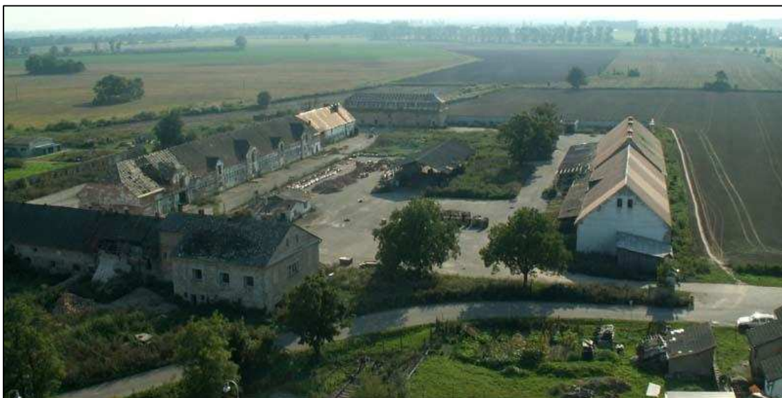
Zderazský dvůr s tzv. zámečkem v popředí (09/2006)

správním, postupně i obytným účelům, což trvalo následující dvě století. První polovina 90. let 20. století přinesla zánik podniku Státní statky, jež zderazský dvůr po desetiletí využíval jako jedno ze svých hospodářství. Se soukromým majitelem (firma Old Pine Store) a vystěhováním posledních nájemníků bytových prostor začíná období rychlé devastace areálu nyní již bývalého hospodářského dvora. Destrukce objektů nabývá na obrátkách především v období posledních 2-3 let, kdy se zcela nezajištěný areál stává lehce přístupný zejména „sběračům“ kovů. Řada budov je v současnosti v dezolátním stavu a hrozí jim v brzké době zřícení. Kuriózně může působit fakt, že areál dvora v takto zuboženém stavu byl v tomto roce (tj. 2011) nabízen realitní kanceláří k prodeji za poměrně značnou částku.