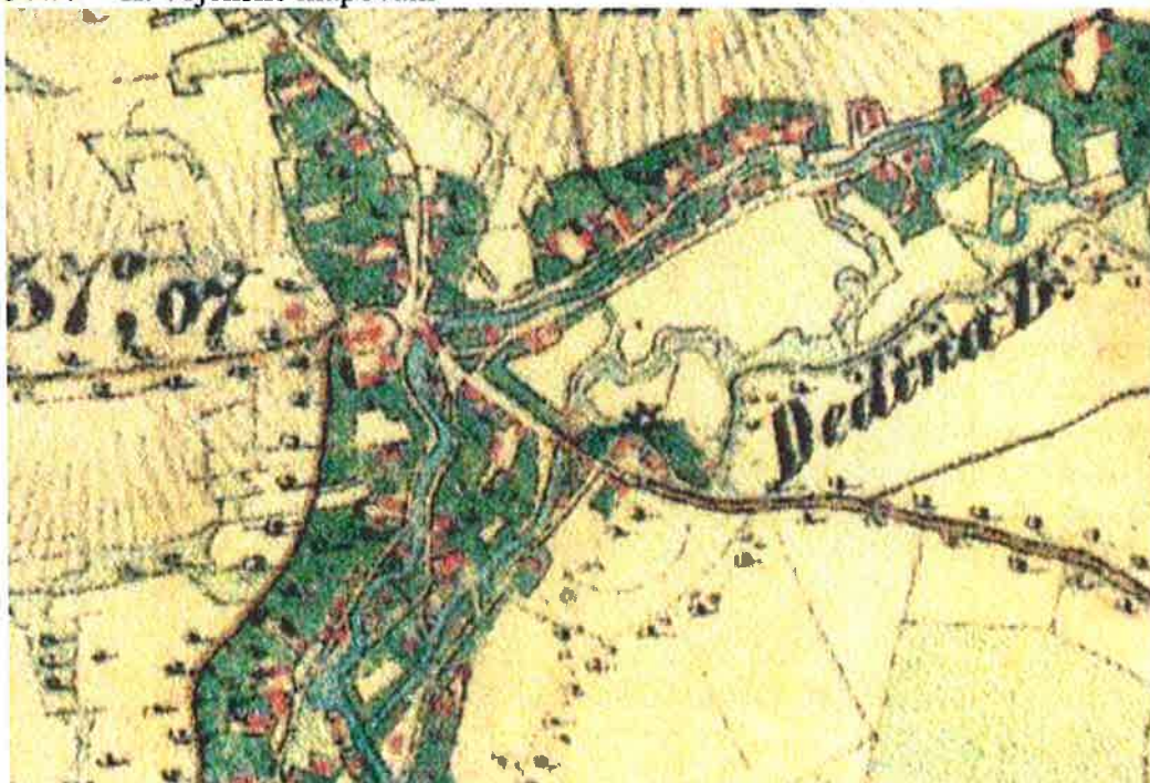
Obr. 2 – II. vojenské mapování

Mlýn je pravidelně vyobrazován na dalších mapách, jako jsou II. a III. vojenské mapování, stabilní katastr aj. vždy s nakresleným mlýnským kolem.