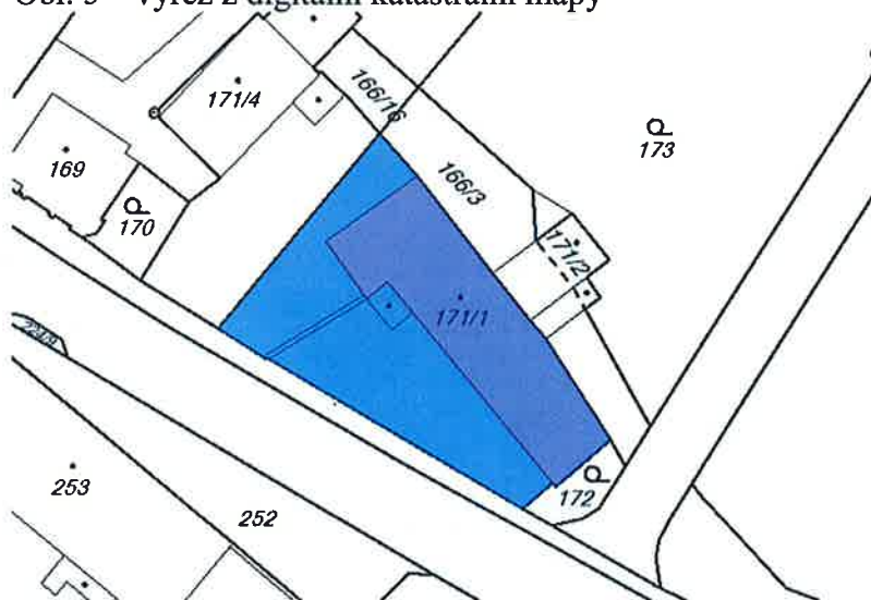
Obr. 5 – výřez z digitální katastrální mapy

Budova je jednopatrová. Přízemí je vyzděné opukou a kamením (opuka se zde hojně využívala k výstavbě budov a využívala se pro stavbu zídek kolem pozemků) a je částečně zaklenuté poloklenbou. První patro, štít a mlýnská lednice jsou vyzděny pálenou cihlou. Střecha objektu je nyní z pálených tašek bobrovek (původně opatřena šindelem). Na jižní straně orientované k silnici je zachován zeleně polychromovaný pískovcový vstupní portál. Zelená barva je ještě patrná na některých dřevěných oknech. Na severní straně budovy směrem k areálu cukrovaru se ve výšce prvního patra nachází dřevěná pavlač s jednoduchými dekorativními prvky. V objektu jsou dva komíny. Součástí objektu je rovněž byt mlynáře se zachovalými interiérovými prvky z 30. let 20. stol., jako jsou obklady v koupelně, baterie apod. Fasáda objektu má na jižní straně pod krovem jednoduché zdobné prvky.